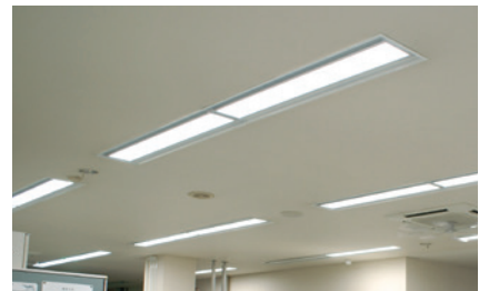
※ LED 照明

当社は省エネ法の規定に基づく特定事業者に指定され(2010年)、LED照明への切り替え(※写真)、太陽光発電システムの導入、工場の集約、などで省エネを進めCO 2 削減を図っています。