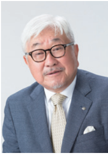
株式会社 サンエス 代表取締役社長