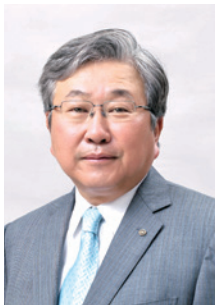
株式会社 サンエス 代表取締役社長