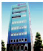
⑧東京支店 (西麻布ビル)