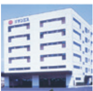
④第二流通センター