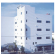
③第一流通センター