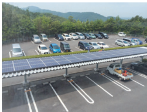
テクノセンター来客用駐車場屋根