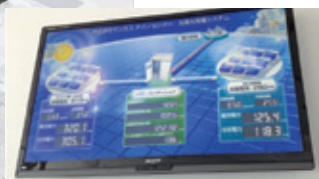
発電量公開モニター