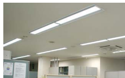
※ LED 照明

当社は省エネ法の規定に基づく特定事業者指定され(2010年)、LED照明への切り替え(※写真)、太陽光発電システムの導入、工場の集約、ノート型パソコンの内蔵蓄電池の有効利用などで省エネを進めCO 2 削減を図っています。