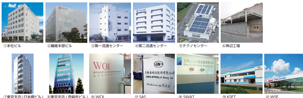
①本社ビル ②繊維本部ビル ③第一流通センター ④第二流通センター ⑤テクノセンター ⑥神辺工場 ⑦東京支店(日本橋ビル) ⑧東京支店(西麻布ビル) ⑨WOI ⑩SAS ⑪SWAT ⑫KSET ⑬WSE