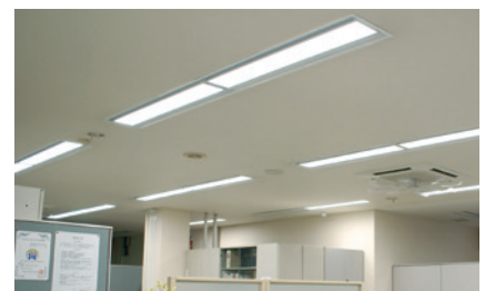
※ LED 照明

当社は省エネ法の規定に基づく特定事業者指定され(2010年)、LED照明への切り替え(※写真)、太陽光発電システムの導入、工場の集約、ノート型パソコンの内蔵蓄電池の有効利用などで省エネを進めCO 2 削減を図っています。