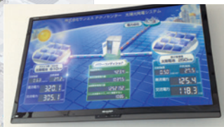
発電量公開モニター