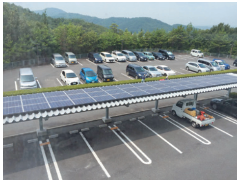
テクノセンター来客用駐車場屋根