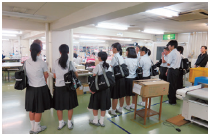
第一流通センター

福山市全公立中学校の職場体験「チャレンジウィークふくやま」の一環として、サンミネラル事業部のサーバーパネルの分解から清掃、組立検査、シールの貼り換え作業、梱包作業までの業務体験をしてもらいました。当事業部の受け入れは今年で10回目です。