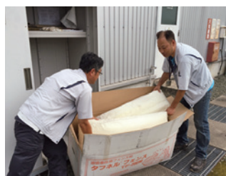
オイルフェンスの準備