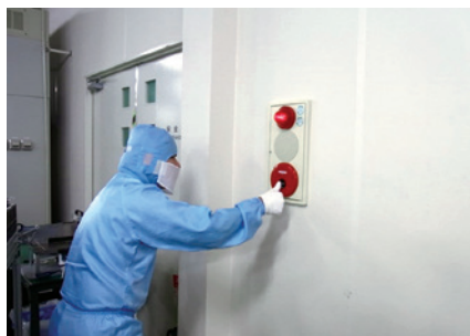
避難訓練(テクノセンター)