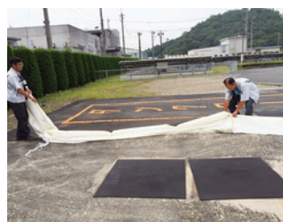
オイルフェンスを使用して流出防止