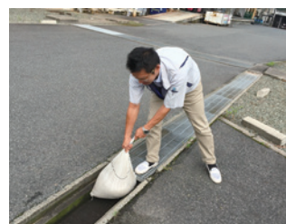
土嚢を使用して流出防止