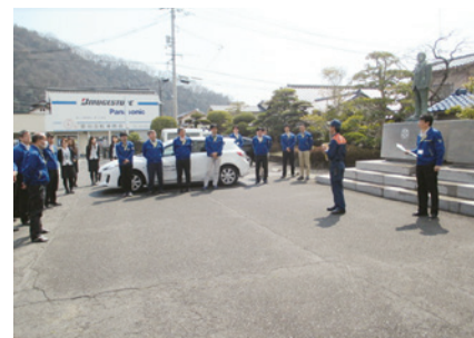
避難訓練(第一流通センター)