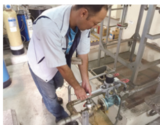
元バブルの締切り

定期的に手順の見直しを行い必要に応じて改定する。また、環境緊急事態が実際に発生した場合は定期的に手順の見直しを行い必要に応じて改定する。