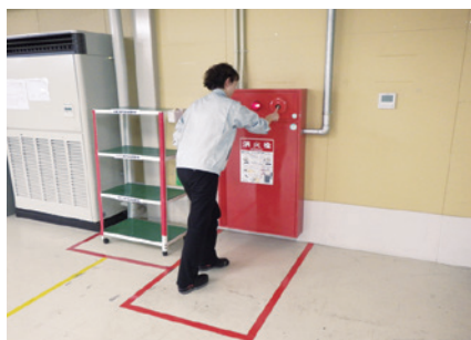
避難訓練(神辺工場)